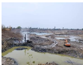
หน้าเหมืองปัจจุบัน

พื้นที่โครงการประทานบัตรที่ 33638/16367 ของทก. โรงงานไม่บดหินยังล้าง