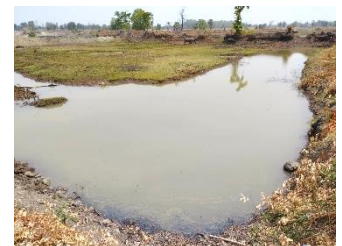
บ่อดักตะกอน บ1