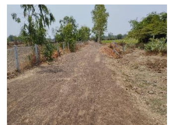
แนวเวนทำการทำเหมือง