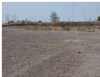
กองเปลือกดินและเศษหิน